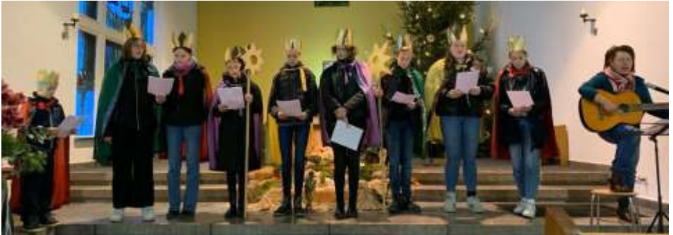
Sternsingerinnen in Hardeggen

Wir beten, dass die Würde und der Wert der Frauen in jeder Kultur anerkannt werden und dass die Diskriminierungen, denen sie in verschiedenen Teilen der Welt ausgesetzt sind, aufhören